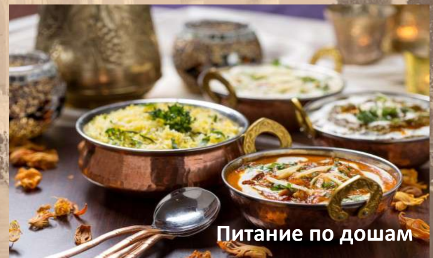
Питание по дошам